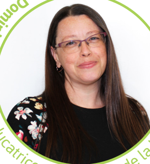
éducatrice responsable de la halte-garderie