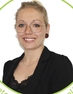
intervenante aux ateliers parents-enfants