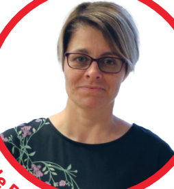
intervenante en sécurité alimentaire