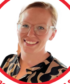
intervenante en sécurité alimentaire