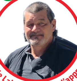
préposé à l'approvisionnement