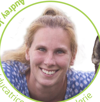
aide-éducatrice en halte-garderie