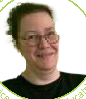
animatrice motricité et éducatrice en halte-garderie