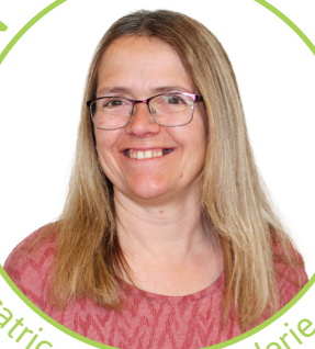
éducatrice en halte-garderie