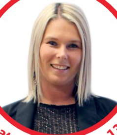
coordonnatrice de La table 138